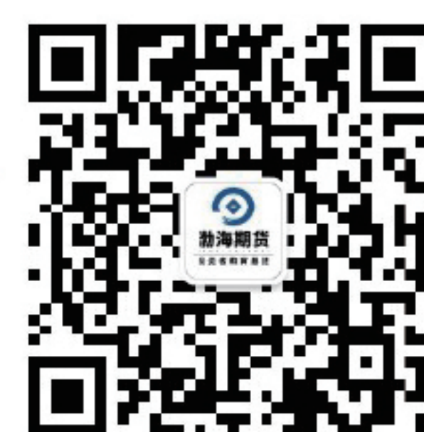
渤海期货投教基地