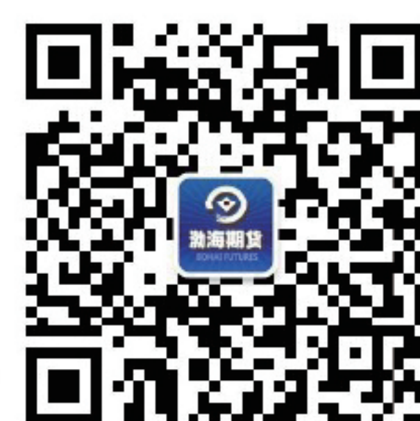
渤海期货股份有限公司 微信公众平台

5、卖方企业需保证交割当月有足够发票开票额度： 无法开出发票会造成开票违约并扣收滞纳金。